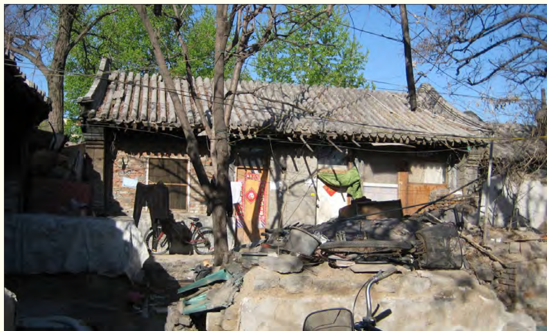
▲ 已充作民宅的立马关帝庙旧址

北京的关帝庙甚多，但比较著名的且规模如此之大，建筑如此之辉煌而又能完整保存下来的实属不多见。令人欣慰的是，随着蓝靛厂一带的拆迁建设，北京海淀区政府于2001年11月将此庙列为区重点文