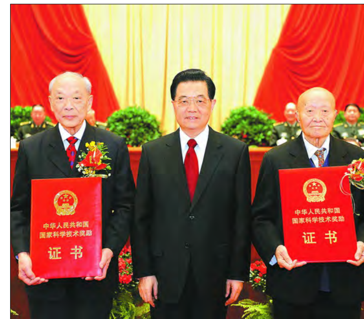
▲ 胡锦涛同志向师昌绪先生授予国家最高科学技术奖。右一为师昌绪先生。