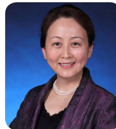
北京市先进工作者： 北京航空航天大学生物与医学工程学院教授、博导，环境生物学与生命保障技术研究所所长，月宫一号总设计师、首席科学家，俄罗斯自然科学院外籍院士，国际宇航科学院通讯院士 刘红