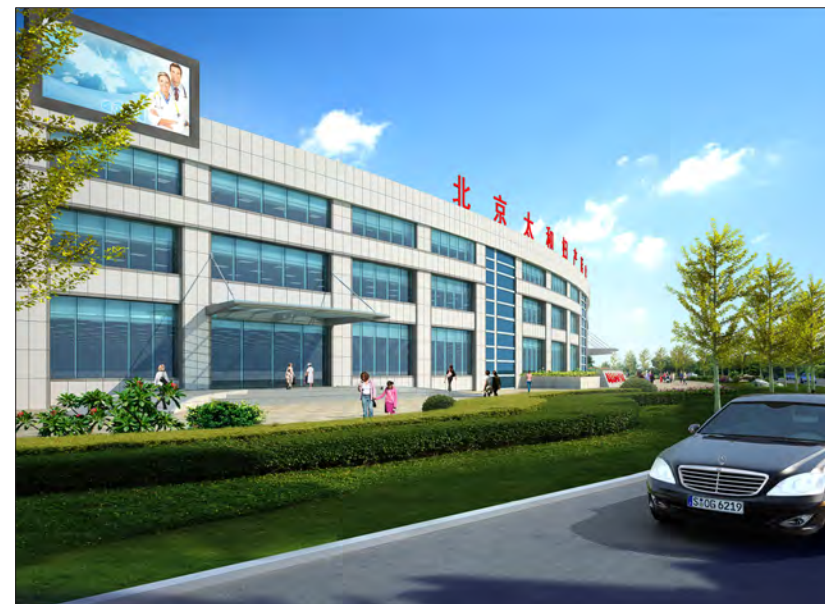
▲ 北京太和妇产医院

所以大健康产业实际上是一个观念的普及，必须形成闭环的管理。例如，一个心血管糖尿病病人，合并了心血管，他如果不注意，可能安了支架或者搭桥，如果还不注意，并不是没有再爆发的可能。因此还是要回到治未病阶段，需要把未病、已病、未病形成一个闭环，来创建大健康产业，然后再去延伸到体育，包括文化也是大健康的一部分，只有健康的心理、健康的身体综合在一起才是健康的评判标准，所以大健康产业的落地需要夯实。我们目前还是以做社会资本民办医疗机构为前导，逐渐产生出大健康的概念，但从长远来看，治未病才是基础。