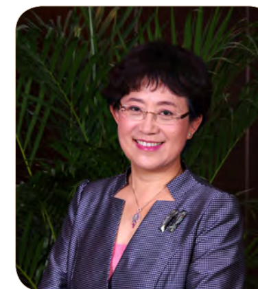
北京市劳动模范： 北京大学第三医院院长、党委副书记，主任医师、教授、博导，长江学者 乔杰