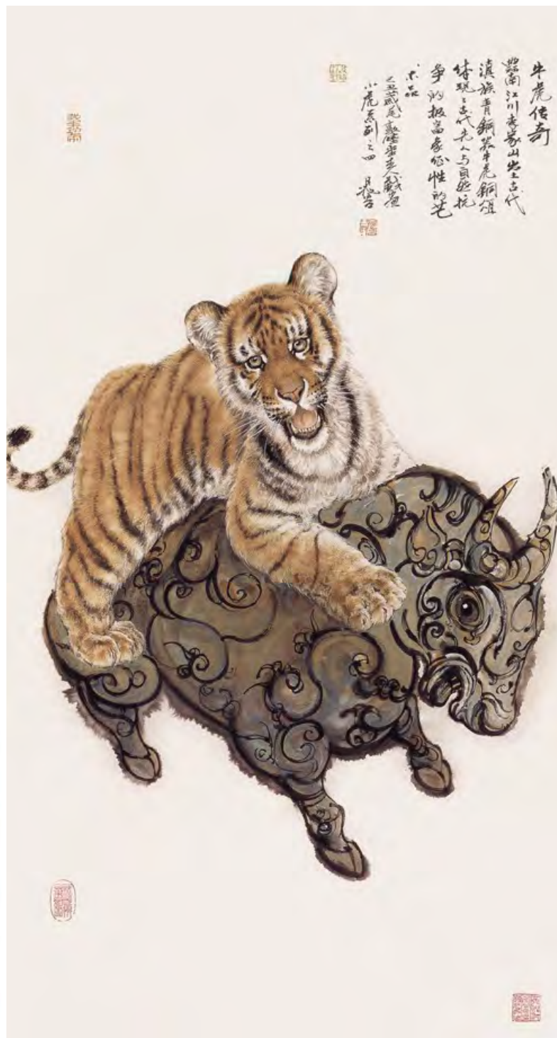
▲ 生肖题材作品——牛虎传奇

画是心像，画是心声，惟有纯净的思想、真善美的心灵，才能画出这样的境界。晁谷始终坚持用自己独特的绘画语言来诠释和发扬中国传统文化，以独特的艺术灵性和才智，用艺术特定的表现语言向人们倾泻着自然界的美好景象，启迪和鼓舞着人们的心灵。艺术需要灵感，如同生命离不开灵魂一样，他正在逐步地融入这块神圣的沃土，衷心地祝愿晁谷创作出更多、更美的作品。◆