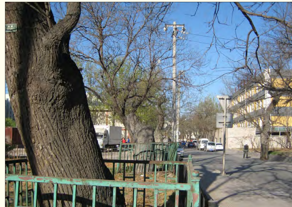
▲ 蓝靛厂尚存的几株老槐树