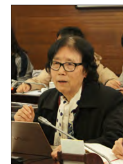
著名古建筑专家、国家一级注册建筑师 郭黛姮

一个城市的厚重主要在于文化力量，在文化方面的物理表现实际上就是一个城市的图书馆、博物馆和艺术馆。“三山五园”博物馆建设必须有大局观和大思路，一定要与文物保护结合起来，要采用现代科技手段，结合现代人的审美情趣和阅读习惯，不仅仅是固态的表征，要让观众感受到其间的乡愁。要具有以下特性：一是有声传递的活态性。二是体验性和互动性。三是信息化，与科技融合。四是重视语言景观。要建设一个由政府搭台、企业参与、高校提供资源的语言博物馆，作为海淀“三山五园”博物馆的一部分，使得整个博物馆能够活现。◆