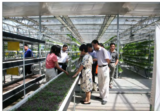
▲ 参观农业科技展示园