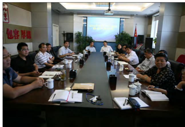
▲ 调研老旧小区改造